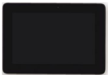
Основное устройство Maxwell 10S S30853-H4006-R101

Новый этап развития систем для делового общения