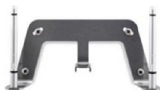
Комплект для крепления на стену S30853-H4030-R101