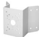
PFA151 Угловое крепление