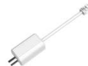
LR1002 Конвертер ePoE – коаксиальный кабель