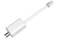
R1002 Конвертер ePoE – коаксиальный кабель