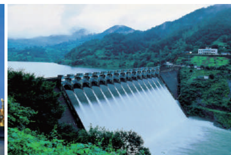
Вода и очистные сооружения